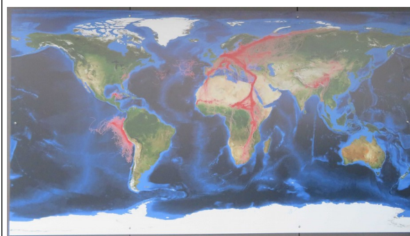
Carte de suivis des migrations animales

Vue lors de la visite de l' Institut Max Plank